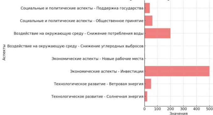
Рисунок 1. Развитие инноваций в секторе альтернативной энергетики

Внедрение инноваций в альтернативной энергетике всегда связано с вызовами социальной и политической природы. Отношение общественности к таким изменениям зависит от доступности технологий, их влияния на повседневную жизнь и создания новых рабочих мест. Для успешного внедрения технологий необходимо активное сотрудничество между государственными учреждениями, частным сектором и населением. Политическая поддержка через субсидии, налоговые льготы и долгосрочные стратегии создания устойчивых энергетических систем становится ключевым фактором в достижении успешных изменений на национальном и международном уровне [2].