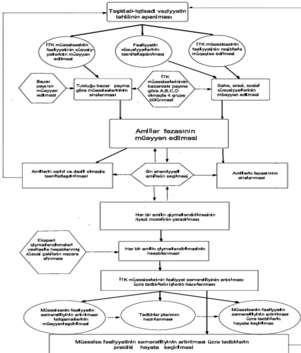
Şəkil 2. İnvestisiya-tikinti kompleksi müəssisələrinin fəaliyyətinin səmərəliliyinin qiymətləndirilməsi alqoritmi